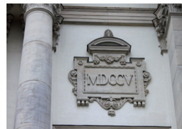
Eine römische Jahreszahl an einer Kirchenwand

Wenn du ganz aufmerksam bist, kannst du manchmal an alten Gebäuden ein lateinisches Sprichwort, eine kleine Inschrift oder eine Jahreszahl in römischen Zahlen entdecken. Kennst du so einen Ort in deiner Nähe? Diskutiert in eurer Klasse oder fragt euren Lehrer.